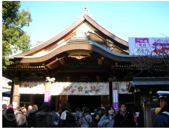
学问の神様 湯島天神